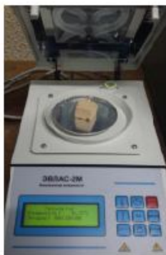
Рисунок 2 – Анализатор влажности ЭВЛАС-2М

Нами было определено количество капиллярной влаги на анализаторе влажности ЭВЛАС-2М (рисунок 2) при температуре 110 °С в течение 60 мин соответствий с ГОСТ-ом [4].